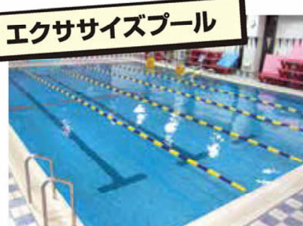
エクササイズプール